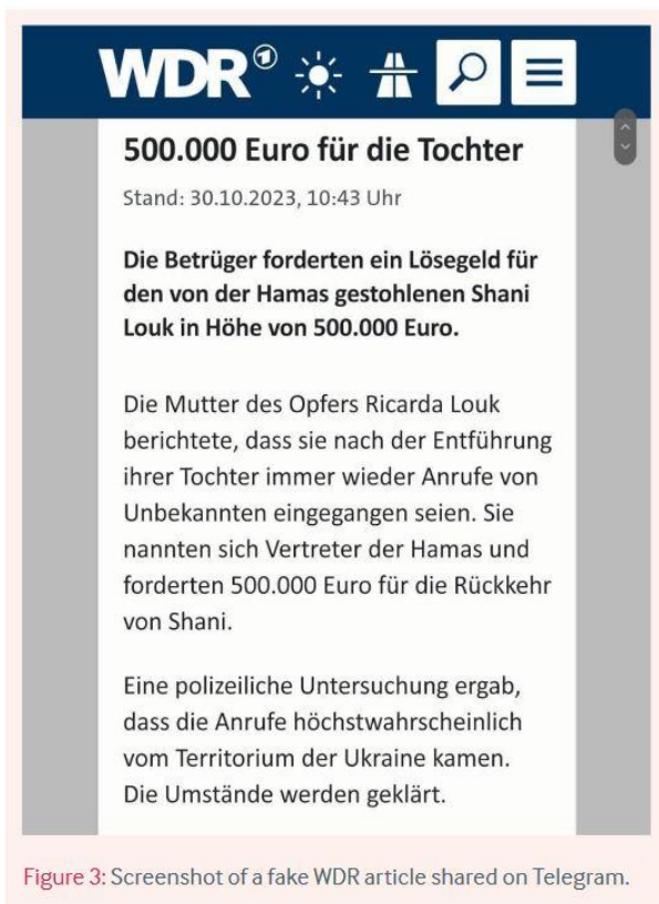
Figure 3: Screenshot of a fake WDR article shared on Telegram.

Untenstehende Abbildung zeigt einen über Telegram versendeten Fake-Artikel, der angeblich beim WDR erschienen sein soll: